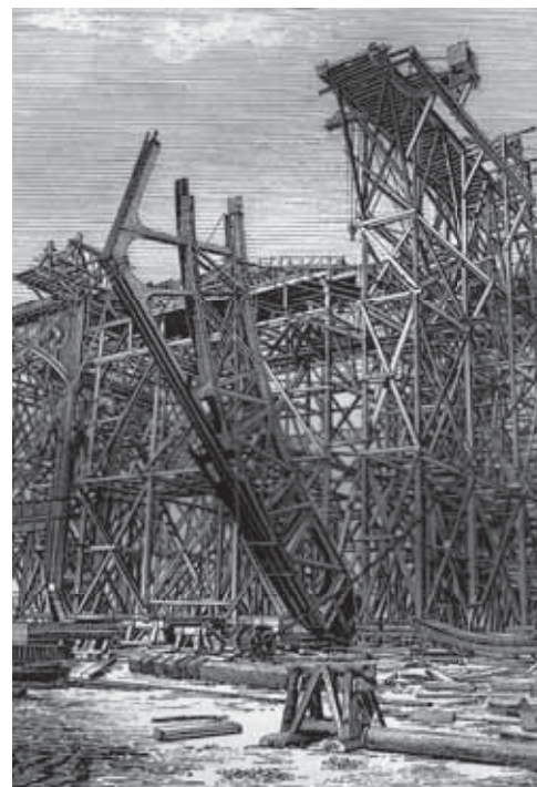
Montage des fermes de 113 mètres, système Fives-Lille (Levage d'un pied-droit), E. Monod, L'Exposition universelle de 1889, Tome 1-Paris E. Dentu, 1890, Page 240.

Au-delà de la prouesse technique, la dimension politique de l'événement