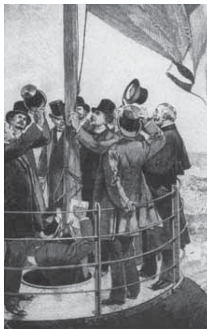
Gustave Eiffel hissant le drapeau tricolore au sommet de la Tour, le 31 mars 1889 (gravure)