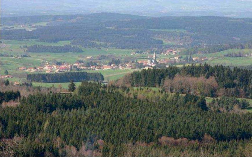
Vue de Marthes.

de Lécluse (Dupont-Tuffier), Faubourg Saint Honoré, établissement libre d'enseignement secondaire et pension pour les élèves du lycée Bonaparte (actuel lycée Condorcet) qui n'a pas d'internat. C'est aussi son lieu de résidence car il y exerce des fonctions de répétiteur.