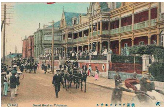
Yokohama, Grand Hôtel.

Il ouvre, vers 1882, un cabinet d'architecte dans la zone réservée aux étrangers à Yokohama et reçoit sa première commande importante pour la construction du théâtre.