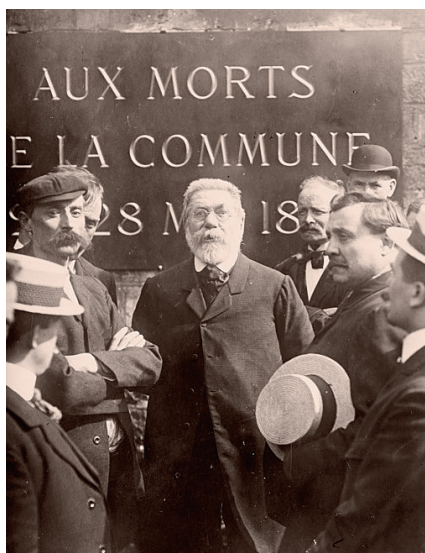
Édouard Vaillant au cimetière du Père Lachaise, rendant hommage aux morts de la Commune de Paris.

Né à Vierzon (Cher) en 1840, diplômé en 1862, Édouard Vaillant complète sa formation par un cursus à la Sorbonne et au Muséum d'histoire naturelle. Docteur ès sciences en