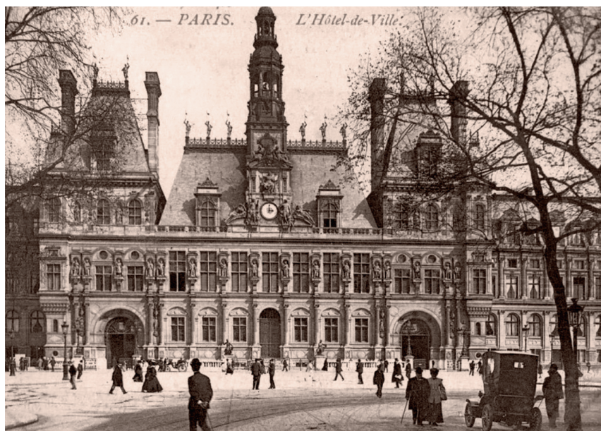
L'hôtel de ville de Paris vers 1900.

Le conseil municipal de Paris, également siège du conseil général de la Seine, comptait quelque quatre-vingts conseillers au début de la III e République. Parmi ces hommes élus pour trois ans au suffrage universel, on comptait seize ingénieurs, soit 3,5 % du nombre total des conseillers. Un chiffre faible si on le compare à la proportion des commerçants et industriels (27 %) et des professions libérales (46 %) 1 .