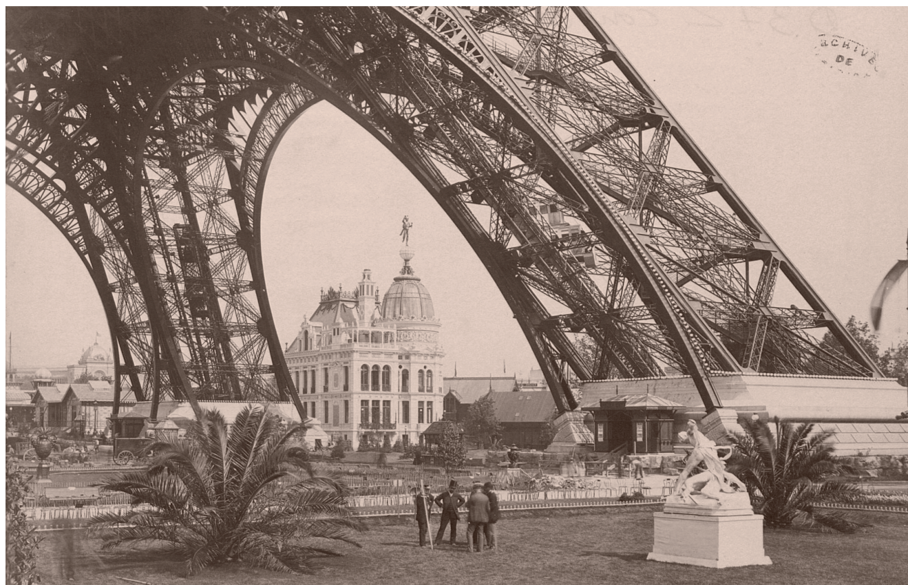
Exposition universelle de 1889.

et des procédés correspondant (1890), des usines frigorifiques (1892), mais aussi de la construction de logements à bon marché par les sociétés ouvrières (1886).