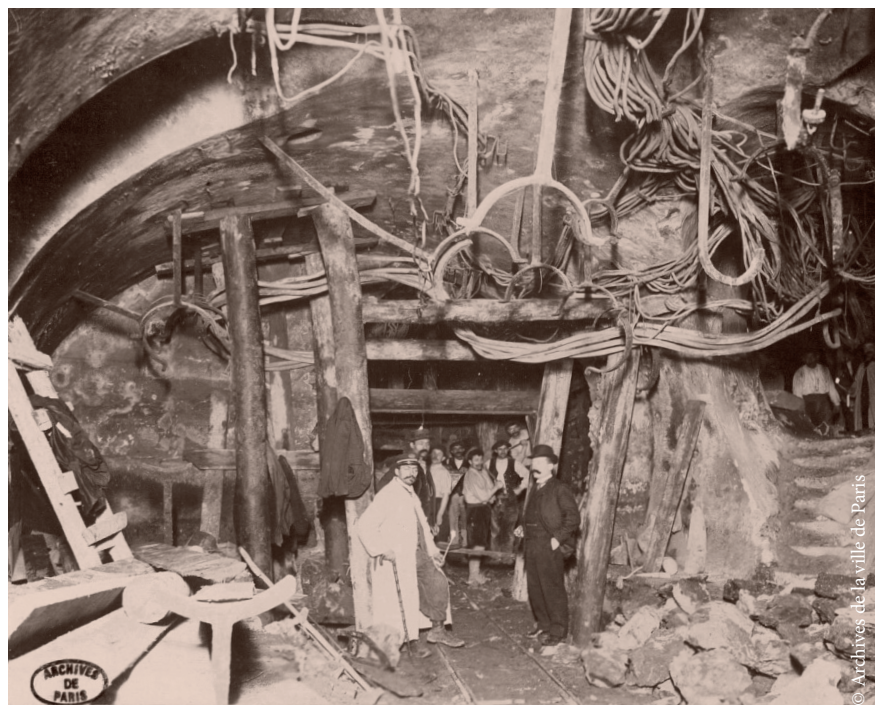
Boisages des égouts désaffectés pour la construction du métro au niveau de la place de la République (4 janvier 1905).

Ernest Deligny fut jusqu'en 1891 président de la sixième commission du conseil municipal 11 , compétente en matière d'eaux et d'égout. Il y défendit le développement de l'alimentation des eaux de sources et de rivières, leur distribution dans les immeubles, l'achèvement du réseau d'égouts et l'amélioration des quais de la Seine. Son rapport le plus remarquable est celui de 1883 sur le projet de règlement relatif à l'assainissement de Paris, dans lequel il apporta toutes les solutions techniques et juridiques propres à mettre en œuvre le tout-à-l'égout, qui aboutirent dix ans plus tard. Il s'intéressa également au problème des transports, tramways et omnibus (rapports en 1883 et 1884), chemins de fer métropolitain (rapport en 1884). Il s'occupa des entrepôts frigorifiques (1889)