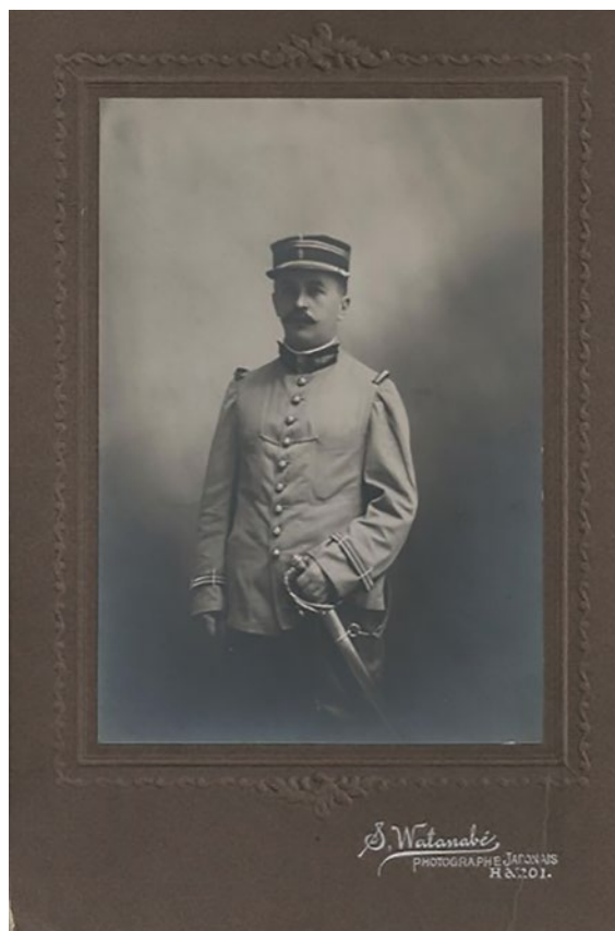
À Hanoï, fin 1914