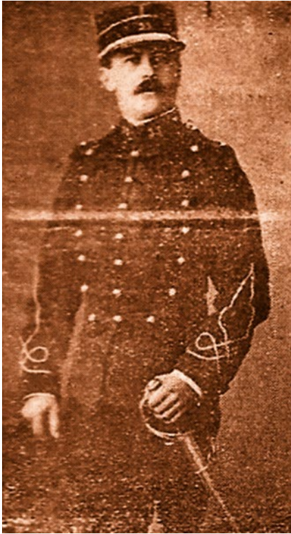
À l'école en uniforme - La politique de Pékin.

impossibles, aussi en 1901, Charignon travaille à un nouveau tracé destiné à amoindrir les déclivités et élargir les rayons des virages. « [P]rogressant et campant au travers la forêt dense, [il] a effectué les repérages et élaboré les plans en s'impliquant beaucoup. »